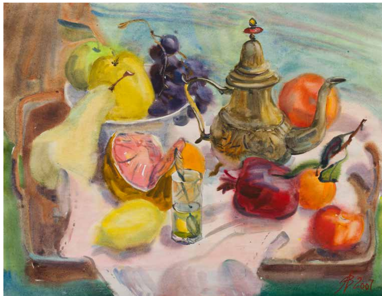
Алена Васильева Марокканский мятный чай. 2007. Бумага, акварель. 49×64