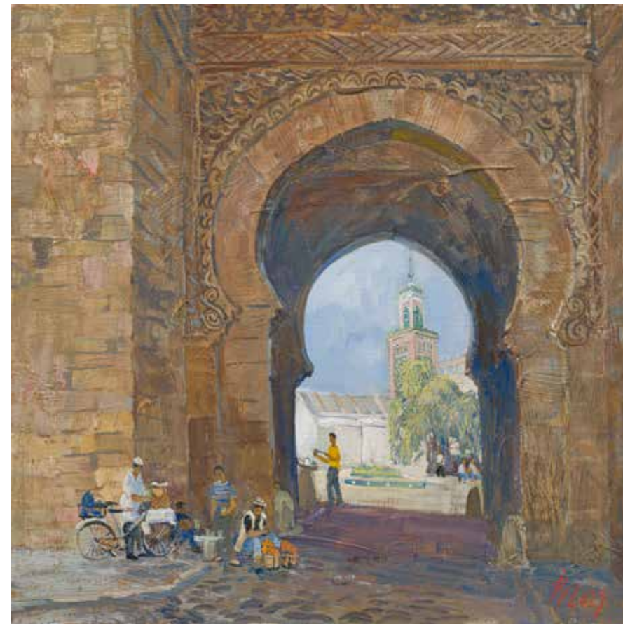
Алена Васильева Медина. Касабланка. 2023. Холст, темпера. 60×60