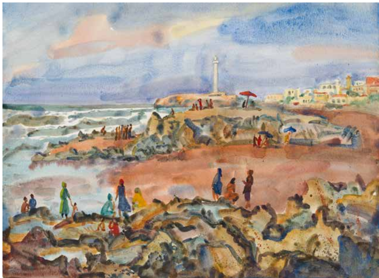
Алена Васильева Берег Марокко. 2007. Бумага, акварель. 35,5×48